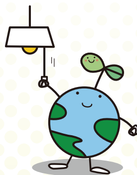
福島県の地球環境保全のキャラクター「エコたん」