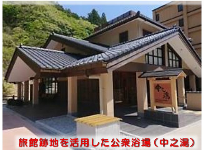
旅館跡地を活用した公衆浴場（中之湯）

▲福島市は、都市再生整備計画事業（土湯温泉地区）により、廃業した旅館を活用した公衆浴場（中之湯）、観光交流センター、建物修景、道路、ポケットパークやイベント活動支援などを実施しました。