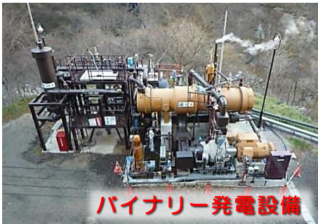
バイナリー発電設備

▲福島市は、都市再生整備計画事業（土湯温泉地区）により、廃業した旅館を活用した公衆浴場（中之湯）、観光交流センター、建物修景、道路、ポケットパークやイベント活動支援などを実施しました。