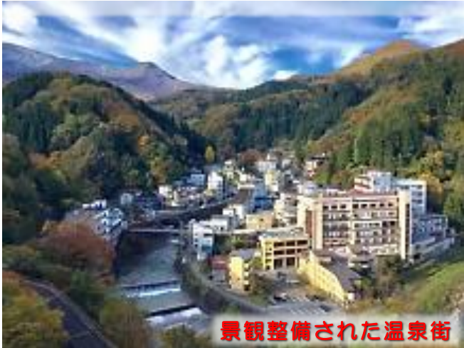
景観整備された温泉街