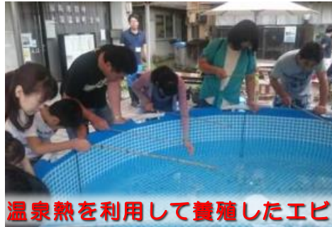
温泉熱を利用して養殖したエビ

◀株式会社元気アップつちゆは、自然エネルギーである温泉熱を利用した発電、エビの養殖、砂防堰堤を利用した水力発電等から得られる収益を地域へ還元するなど、多角的なビジネスモデルを展開しています。