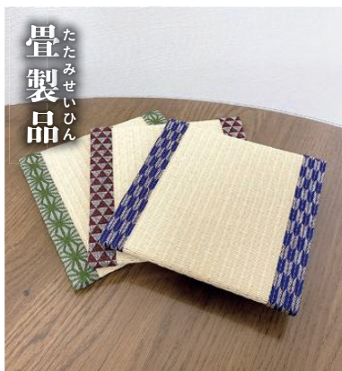
たたみせいひん 畳製品