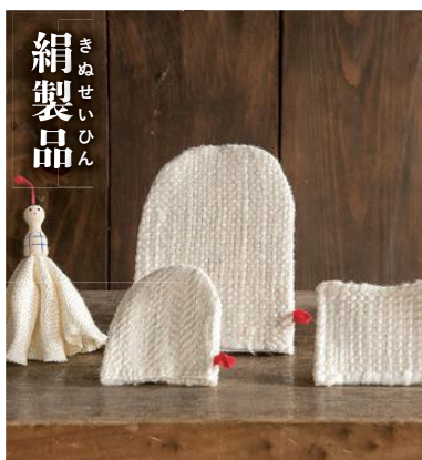
きぬせいひん 絹製品