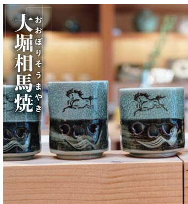
おおぼりそうまやき 大堀相馬焼