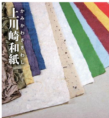
かみかわさきわし 上川崎和紙