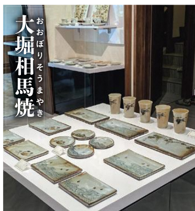
おおぼりそうまやき 大堀相馬焼