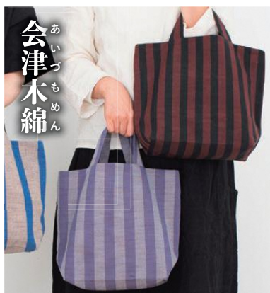
あいづもめん 会津木綿