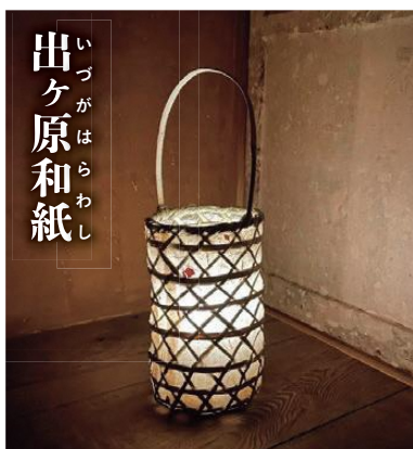
いづがはらわし 出ヶ原和紙