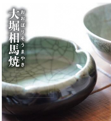
おおぼりそうまやき 大堀相馬焼