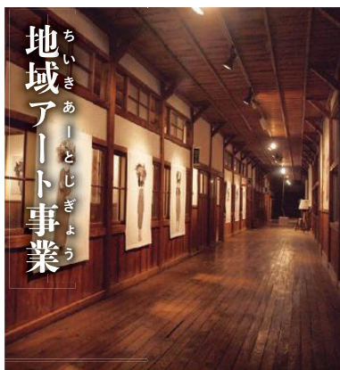
ちいきあーとじぎょう 地域アート事業