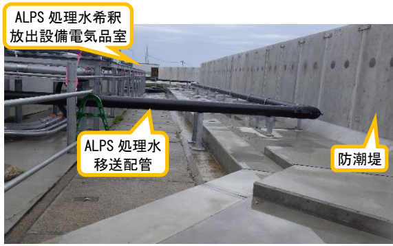
(写真 1 - 1) 防潮堤の設置状況① (南側から撮影)