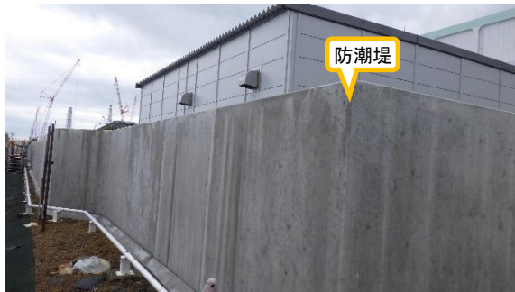
(写真 1 - 2) 防潮堤の設置状況② (北側から撮影)