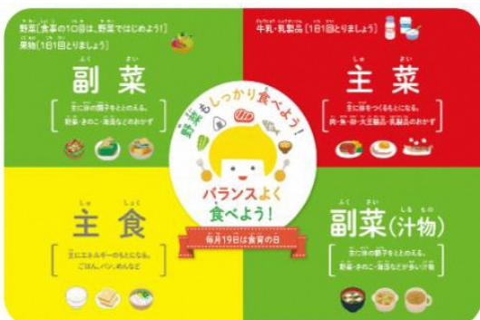
食育のバランスをチェックするランチョンマップ

減塩というと「味が物足りない」「おいしくない」「手間がかかる」「家族が好まない」…味の素(株)の「Smart Salt (スマ塩)」は、そんな多くの人のお悩みを解消するために「うま味やだしをきかせた“おいしい減塩”」を提案しています。 “おいしいなら、減塩の方がいいよね。” それが「Smart Salt (スマ塩)」の想いです。このメニューではお野菜や「お塩控えめの・ほんだし®」のうま味とごまみそ味を活用して塩分少なめですが、満足感のある汁物に仕上げました。