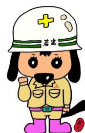
会津若松建設事務所 Facebookイメージキャラクター 〈若犬〉