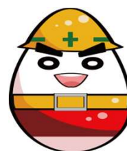
工事看板イメージキャラクター 〈起き上がり五郎〉

起き上がり小坊師をイメージした「起き上がり五郎」を管内の工事現場の標識などで使用しています。