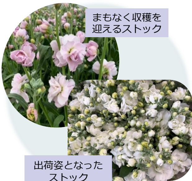
まもなく収穫を迎えるストック