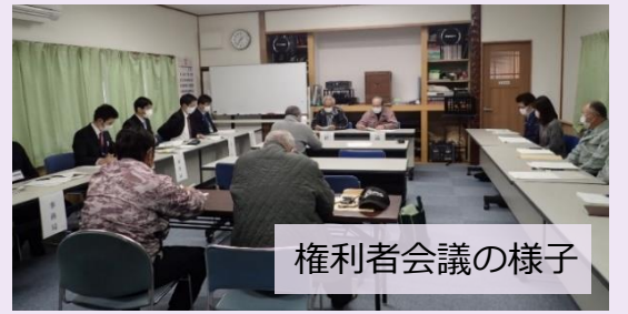
権利者会議の様子