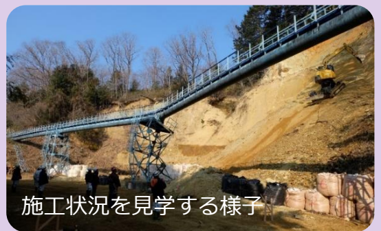
施工状況を見学する様子