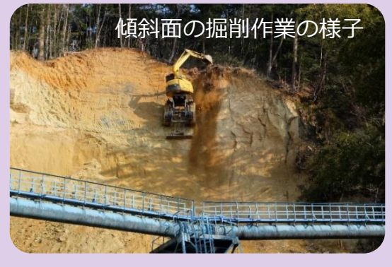
傾斜面の掘削作業の様子