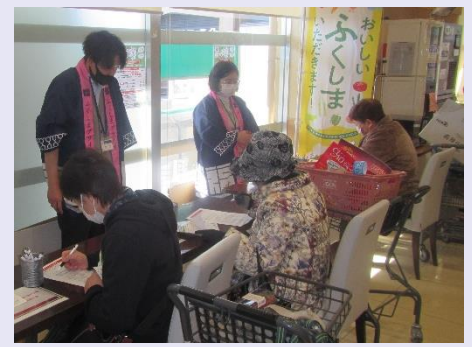
アンケート調査の様子

当所では、皆様から頂いた意見をいかし、引き続き、地産地消に向けた取組を推進してまいります。