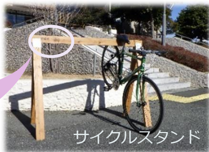
サイクルスタンド