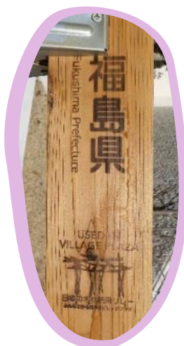
ビレッジプラザに 使用された ことを示す焼印

県では、東京2020オリンピック・パラリンピック大会の理念を引き継いでいくため、大会期間中、選手村ビレッジプラザの建築部材として使用された県産材を身近な木製品等に再加工し、県内の希望する自治体や学校等に配布する取組を進めてきました。