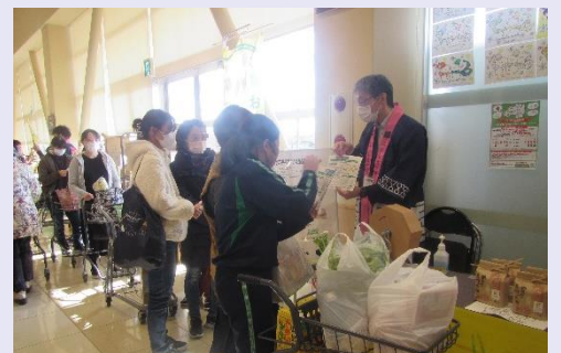
GAPについて説明している様子

当所では、令和5年1月21日（土）に今年度第4回目となる本キャンペーンを株式会社ヨークベニマル相馬黒木店で実施しました。当日は、店内でGAP キャップ ※1に関するチラシを配布したほか、キャンペーン参加者にGAPに関するクイズの出題やキャンペーン内容に関するアンケート調査を行いました。また、実際にGAP認証※2を取得した農産物を味わっていただくために、キャンペーン参加者250名に