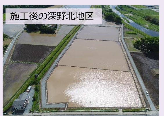
施工後の深野北地区

震災後に、ほ場（農地）の整備に向けた工事に着手し、生き物に配慮した用排水路の整備等も進めてきました。地域の皆様や工事関係者の協力により工事は滞りなく進み、令和4年12月には地区の権利者会議を開催することができました。権利者会議とは、ほ場整備を行っている地区の関係者が集まり、整備された土地の権利等をどのようにするか定める換地計画を決定する会議です。より有効な土地利用ができるよう権利配分を行うことで、地区全体の経営改善が図られます。地区の権利者や関係機関の方々の協力のおかげで、会議はスムーズに進み、無事に終了することができました。