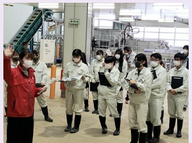
瀧澤氏の説明を熱心に聞く生徒たち