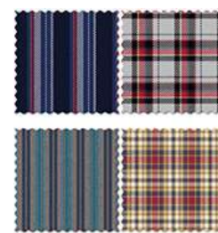
生地シミュレーション