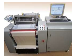
小幅試験織機 (2,200円/時間)