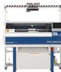
小物専用コンピュータ横編機 (3,900円/時間)