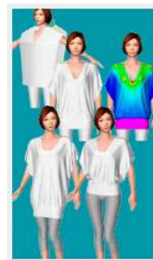
バーチャルサンプル

さらに3Dシミュレーション機能を活用すれば、製品サンプルの着圧を測定でき、製品の着心地等の機能性評価も行うことができます。