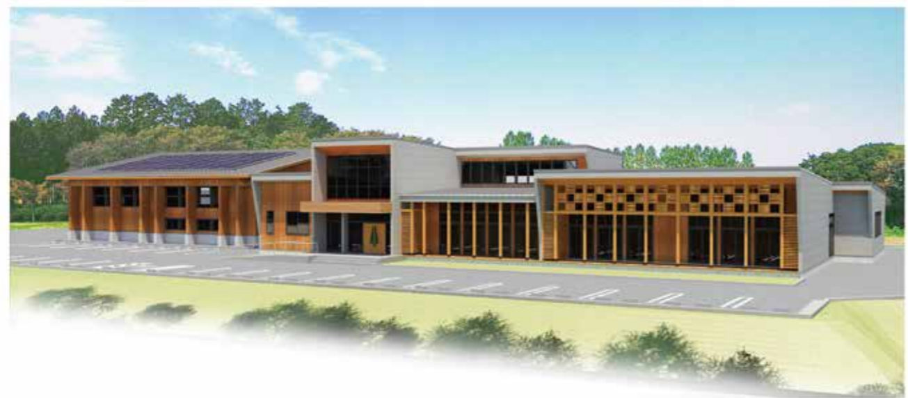
※研修施設パース(予定)