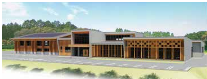
※研修施設パース(予定)