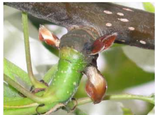
図2 果そう基部病斑

地域の防除暦に従って、散布間隔が開かないよう予防散布を徹底する。また、薬液は、十分量(250L/10a)散布し、散布死角は手散布を行うなど丁寧な散布を心がける。