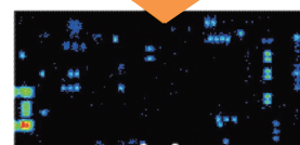
基板上的Pbマッピング例