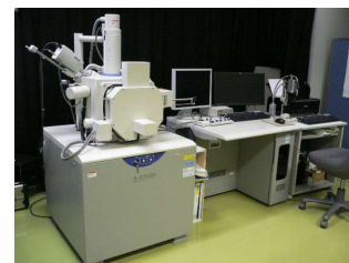
走査型電子顕微鏡 (8,240円/時間)