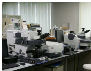
頭微FTIRラマンシステム (8,120円/時間)