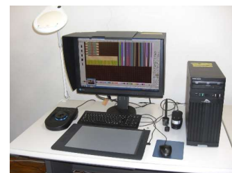
アパレルCADシステム (1,110円/時間)