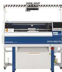
小物専用コンピュータ横編機 (3,900円/時間)