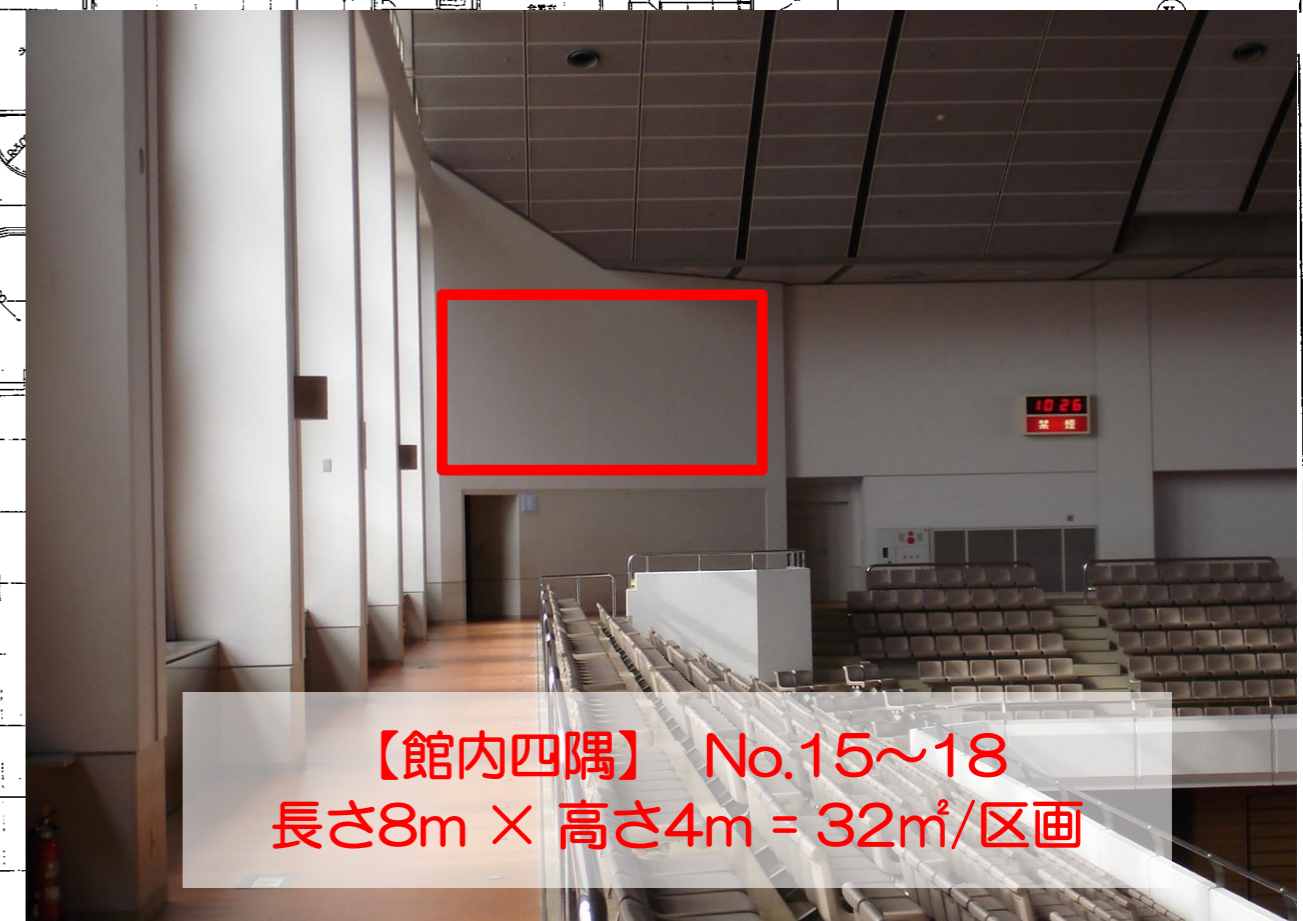
【館内四隅】 No.15~18 長さ8m × 高さ4m = 32m 2 /区画