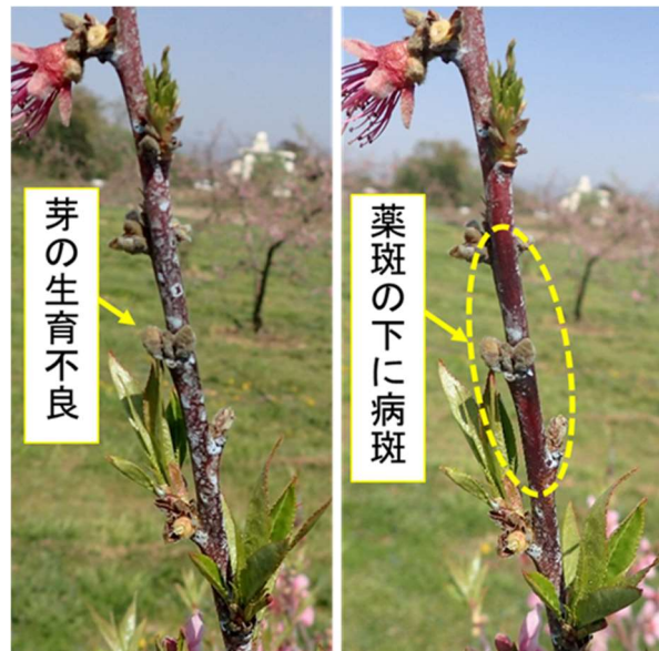
図 2 薬斑によって発見困難な病斑