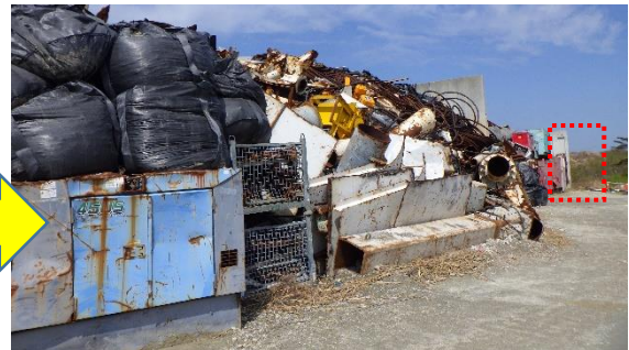
(写真1-2) 一時保管エリアP1 東側の状況② (今回(令和5年3月28日)南側から撮 影)