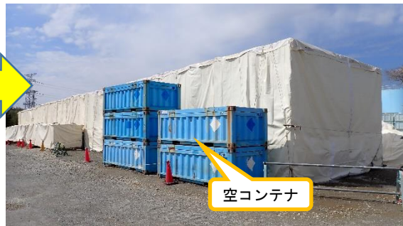
(写真2-2) 一時保管エリアP2 の状況② (今回(令和5年3月28日)北東側から 撮影)