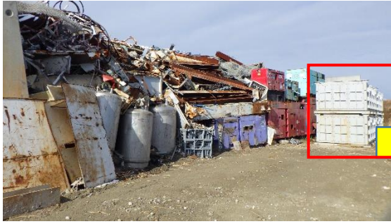
(写真1-1) 一時保管エリアP1 東側の状況① (前回(令和4年12月19日)南側から 撮影)