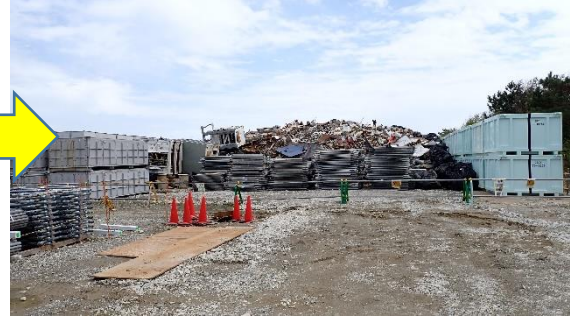
(写真3-2) 第二土捨場仮設集積場所の状況② (今回(令和5年3月28日)西側から撮 影)