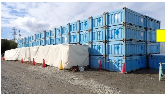
(写真2-1) 一時保管エリアP2 の状況① (前回(令和4年12月19日)北東側か ら撮影)