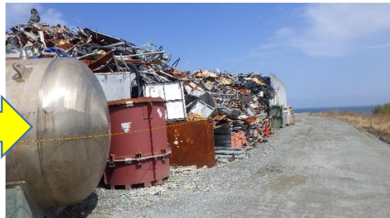
(写真1-4) 一時保管エリアP1 東側の状況④ (今回(令和5年3月28日)南側から撮 影)