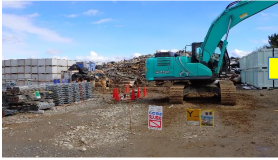
(写真3-1) 第二土捨場仮設集積場所の状況① (前回(令和4年12月19日)西側から 撮影)