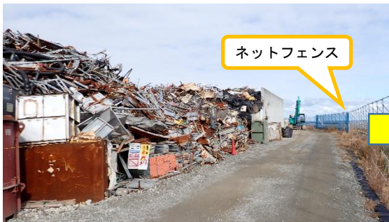
(写真1-3) 一時保管エリアP1 東側の状況③ (前回(令和4年12月19日)南側から 撮影)