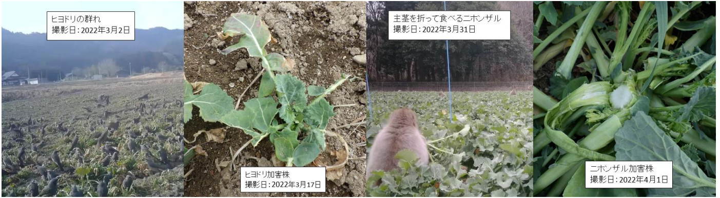
図1 ヒヨドリ(左)及びニホンザル(右)の加害の様子と被害株