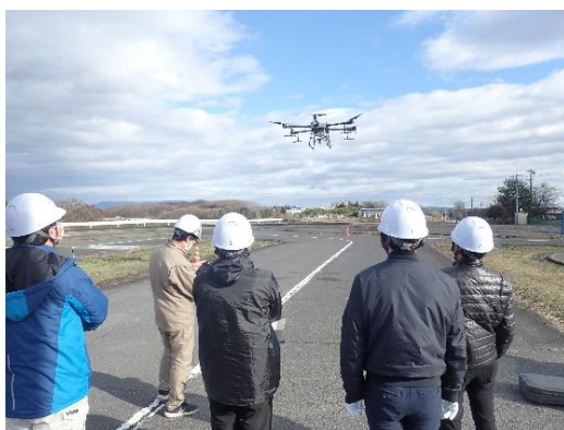
ドローンの飛行操作