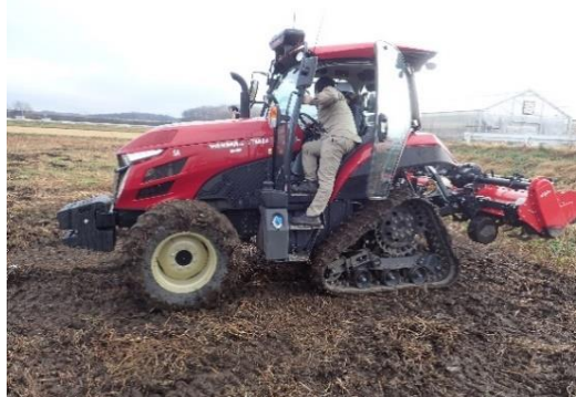
オートトラクタの操作

講義ではスマート農業及びドローンについて学び、実技ではオートトラクタ及びオート田植機、直進アシストトラクタ、ドローンの操作体験を行いました。また、オンライン形式で最新のスマート農業の活用事例や動向について情報提供、意見交換が行われました。