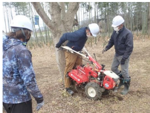
管理機による挟まれ体験