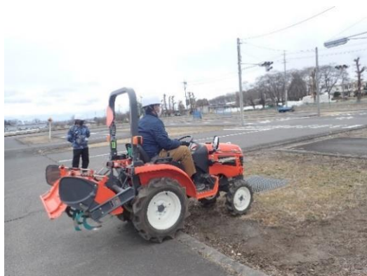
トラクタの段差乗り越え体験

講義では農作業安全研究センターの農機安全 e ラーニングで各機械の事故の特徴を学びました。実技ではトラクタが傾きに弱いことを段差乗り越えで体感し、管理機では挟まれた場合の狭圧防止装置等の緊急停止の手順を確認しました。