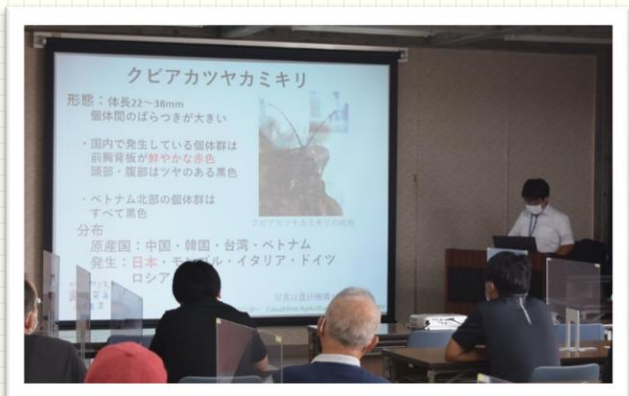
个果樹の害虫に関するセミナーを実施！

県民との関わりや現地調査の結果を通して、その現状・問題点を理解し、地域に即した具体的な改善策・対策を提示できる職員となることを目標としています。