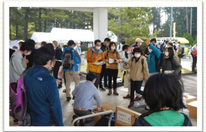
↑林業祭当日の準備の様子

職場の方だけでなく各事務所の担当者の方もアドバイスをくださるので、とてもありがたいです。