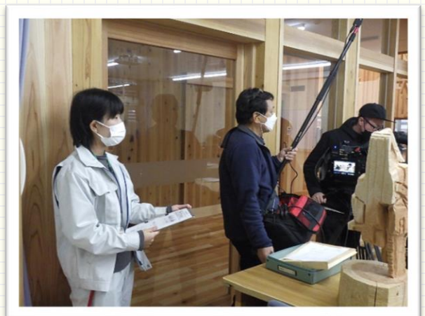
↑林業アカデミーふくしまのPR動画撮影

小さい頃から森が好きで、大学で森林を専門に学ぶ中で人と自然が共存する林業のあり方に興味をもつようになりました。多様な文化や技術を内包する林業という生業の力になりたいと思い、県の林業職を志望しました。