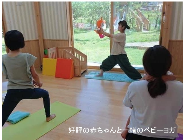
好評の赤ちゃんと一緒にのベビーヨガ