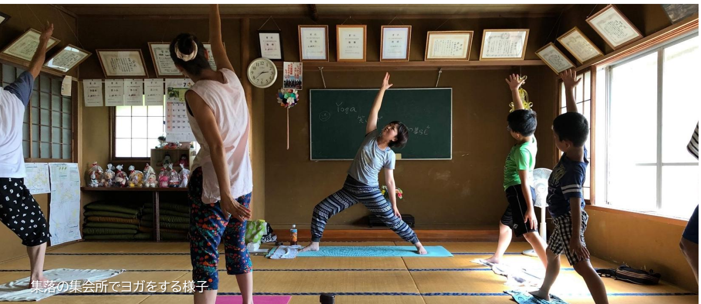
集落の集会所でヨガをする様子

最近では産後で育児が大変とか、心の余裕がない時とかにヨガのレッスンをお薦めしています。自分自身がヨガをしたことで心が変わっていく経験をしたので、会津の皆さんもヨガでおしゃべりしながら心が軽くなってくれればいいなと思います。