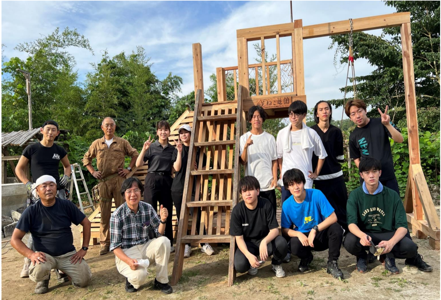
完成した遊具 「芝ねこ遊園」