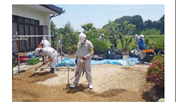
広野町の除染の様子