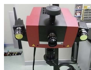
非接触三次元デジタイザ (4,060円/時間)