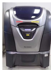
3Dプリンター (AGILISTA-3200) (4,620円/時間)