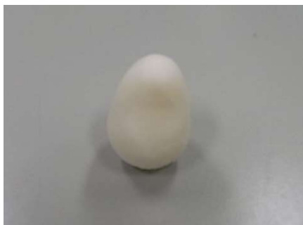
&lt;3Dプリンタ造形例&gt;（右上：モンキーレンチ、右下：ボルト・ナット、左：起上り小法師）