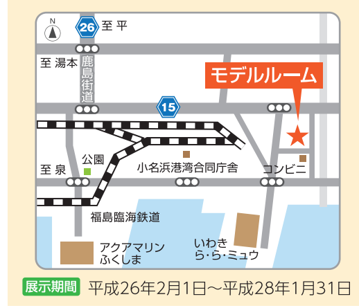
いわき地区/いわき市小名浜字辰巳町23

避難されている皆さまに復興公営住宅への入居を判断する材料としていただくため、モデルルームをいわき市と郡山市で展示しています。居室内はバリアフリーで、高齢の方等にも優しく快適な仕様となっています。