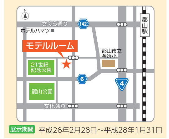
郡山地区/郡山市麓山1-1-1(郡山合同庁舎敷地内)