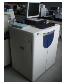
高速アミノ酸分析計 (3,080円/時間)