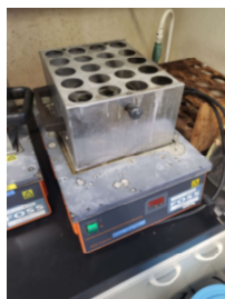
蛋白質蒸留/分解装置 (460円/時間)