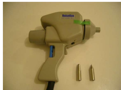
<放電ガン及び電極>

試験機器が人体からEUTへの静電気放電及び近傍への静電気放電による電磁波により、影響を受けないかを確認できます。