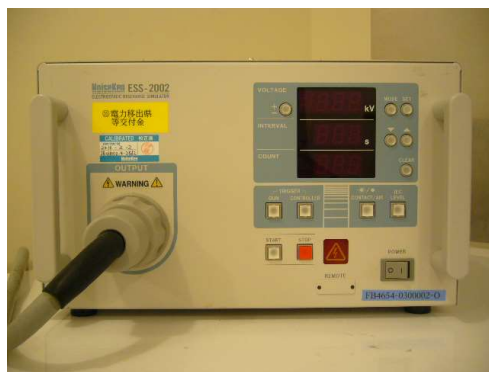
<静電気容量試験機 本体>