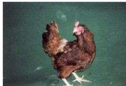
ロードアイランドレッド♀ 当場で育種した増体に優れたロード種