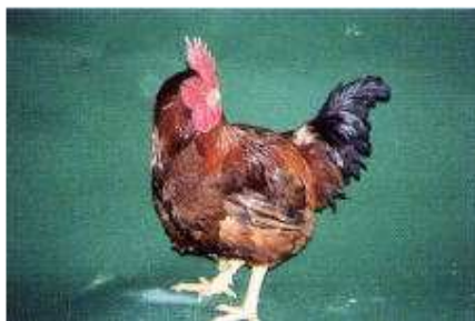
レッドコーニッシュ♂