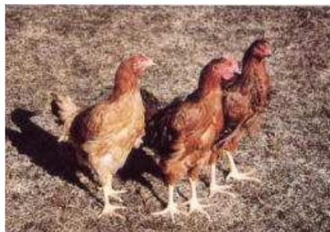
ふくしま赤しゃも