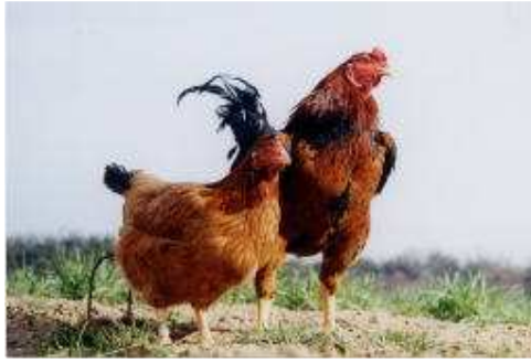
新「ふくしま赤しゃも」