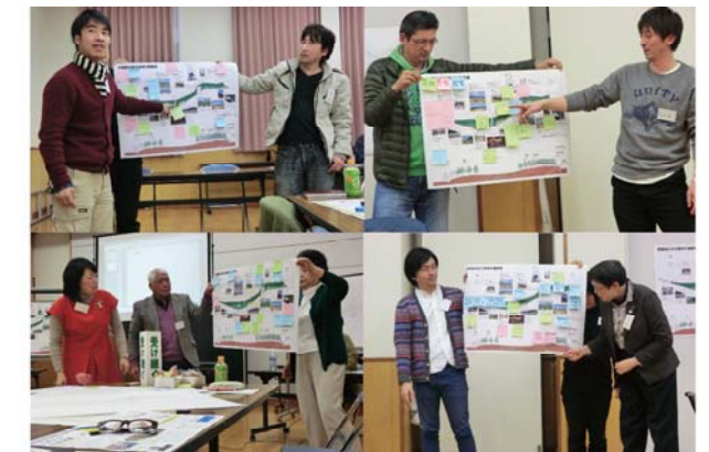
設計案の説明を聞いた感想や質問を発表する

開催日時：2014年1月21日(火) 18:30～20:30 場所：相馬市東部公民館 参加者：14名