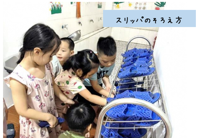
スリッパのそろえ方