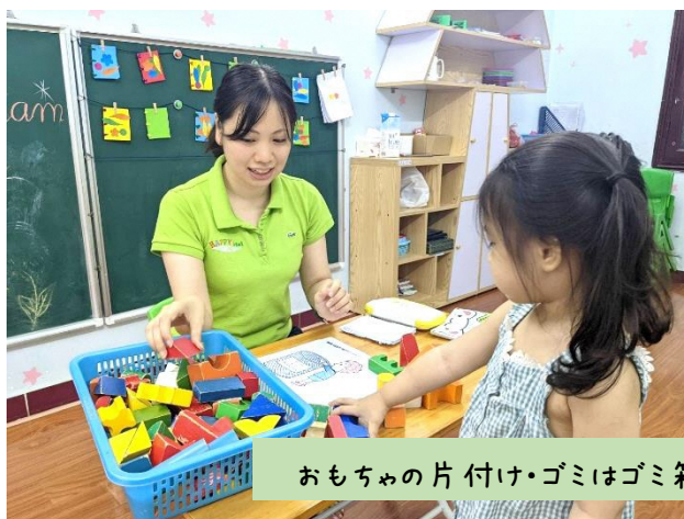
おもちゃの片付け・ゴミはゴミ箱へ