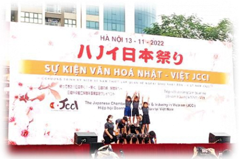
ハノイ日本祭り、組体操の写真です

ステージではハノイにある日本人が通う幼稚園の園児たちの発表等見どころたくさんでした。5歳児が組体操をしていたのでびっくりしました。ベトナムならではのですね!でも一番びっくりしたのは日本人の多さでした!