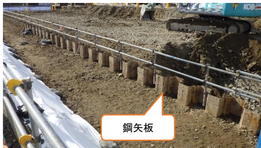
(写真 4) 上流水槽における鋼矢板の設置状況