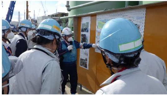
(写真 1 - 1) 東京電力から説明を受けている状況 (放水立坑周辺)