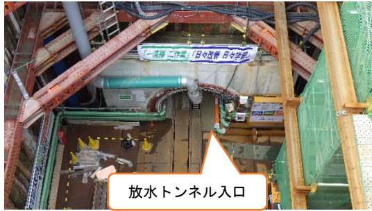
(写真 1 - 2) 放水トンネルの状況