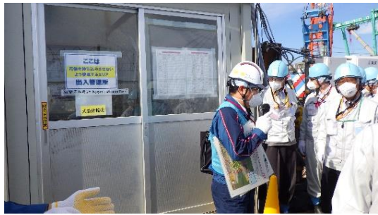
(写真 2) 立坑入口の出入管理所