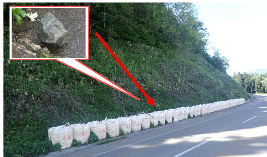
国道121号 中在家丙工区 (喜多方市)