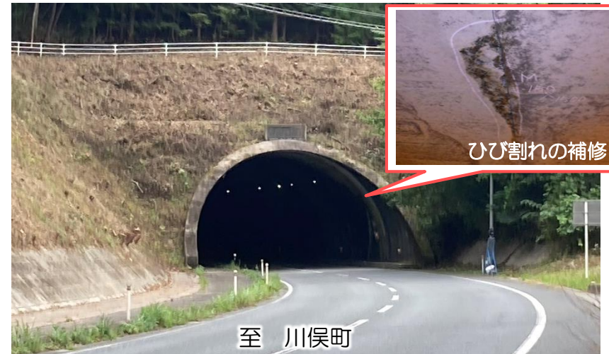
国道114号 昼曾根トンネル（浪江町） 至 川俣町