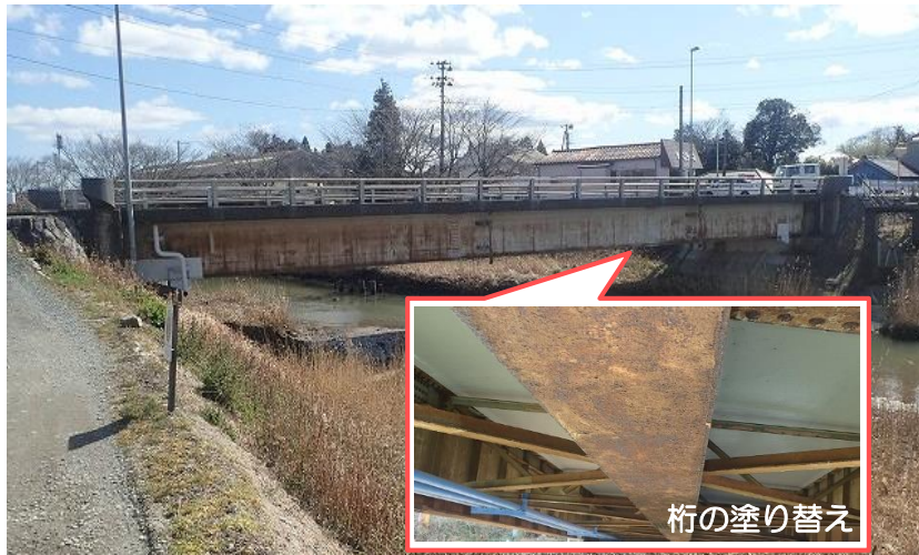
泉岩間植田線 宝珠院橋（いわき市）