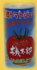
J A会津よつば：南郷トマトジュース