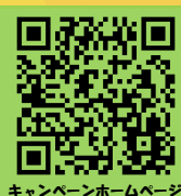
キャンペーンホームページ