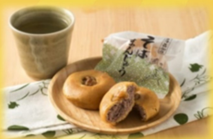
笹屋皆川製菓：そばまんじゅう

また、アンケートにお答えいただいた方には南会津産のりんごをプレゼントします！道の駅しもごうへお越し下さい！