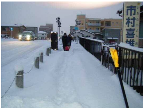
八幡町町内会歩道除雪状況

このたび、2月2日に天栄村湯本区と新たにサポート制度を締結し、地域のボランティアによる歩道除雪が始まりました。