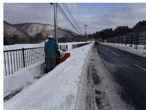
湯本区歩道除雪状況