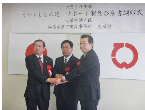
湯本区とのサポート制度締結式