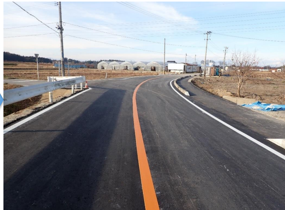
国道118号 天栄村大字田良尾地内 路肩崩落箇所を復旧しました。(令和元年12月片側交互通行解除)