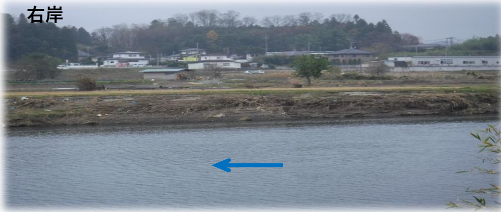
左岸から右岸を望む