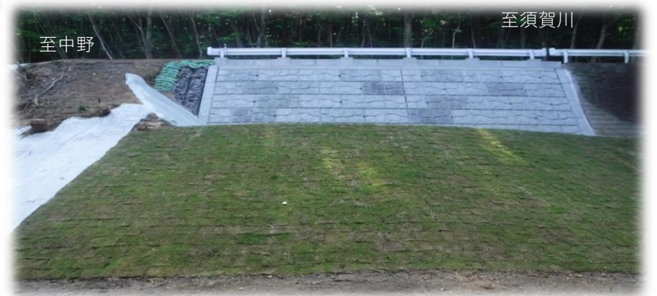
中野方面から須賀川方面を望む