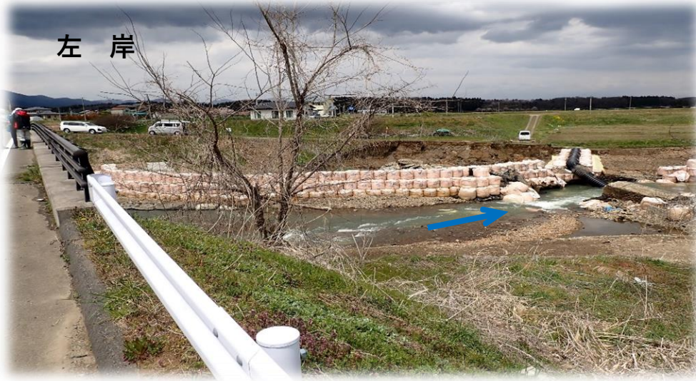
里橋から下流側 右岸から左岸を望む