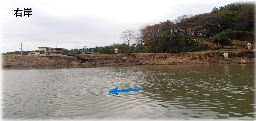
左岸から右岸を望む