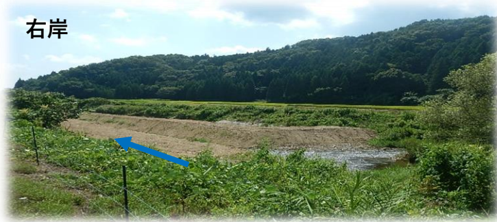
上流(左岸)から下流を望む