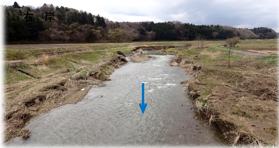
里橋から上流側 下流から上流を望む