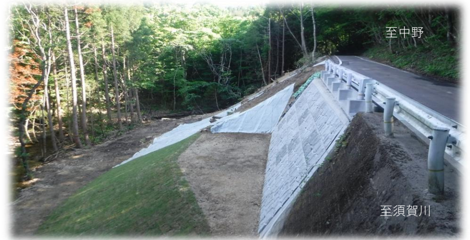
中野方面から須賀川方面を望む