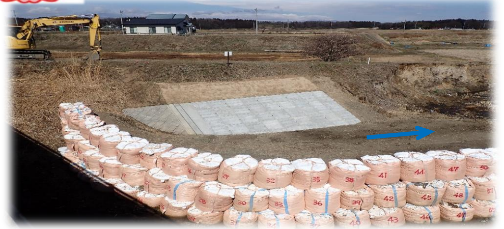
里橋から下流側 右岸から左岸を望む