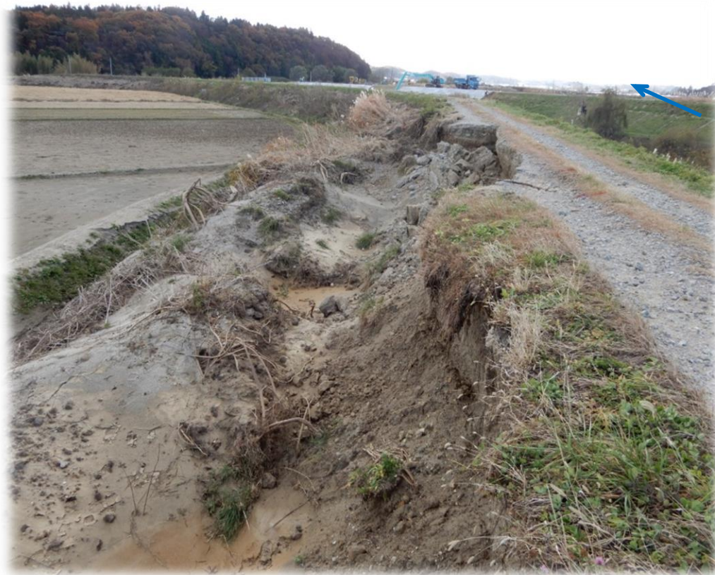
上流から下流を望む