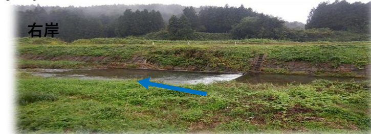
上流(左岸)から下流を望む