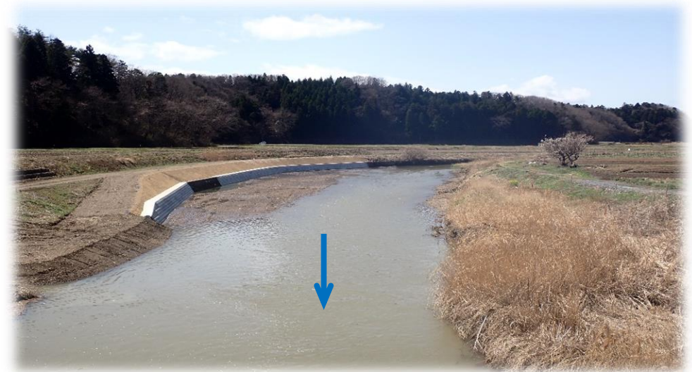
里橋から上流側 下流から上流を望む