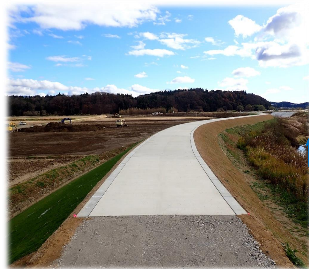
下流から上流を望む