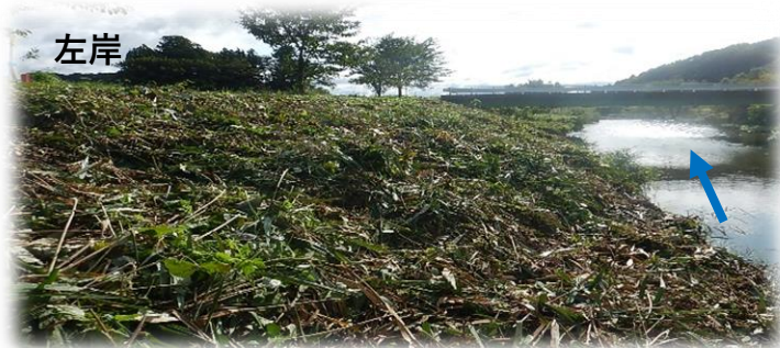
上流から下流を望む