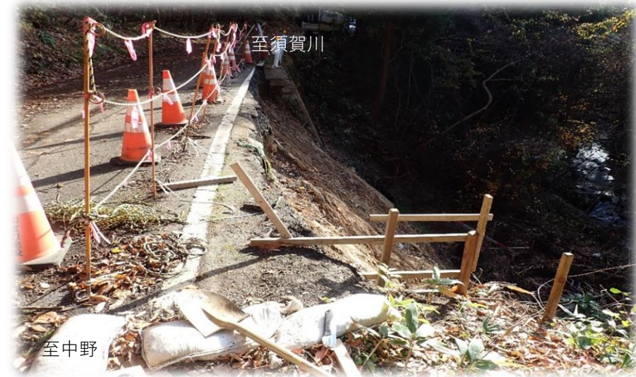
中野方面から須賀川方面を望む