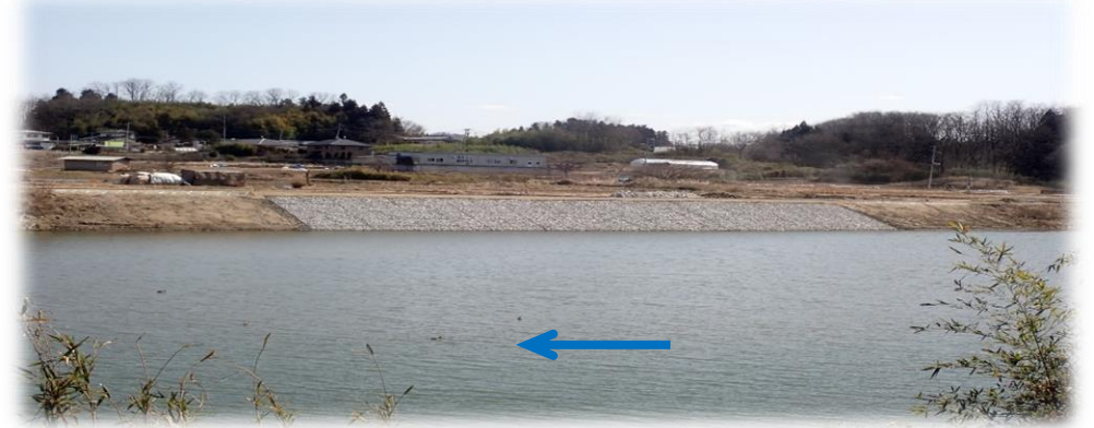
左岸から右岸を望む