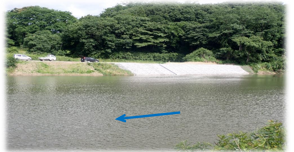
左岸から右岸を望む