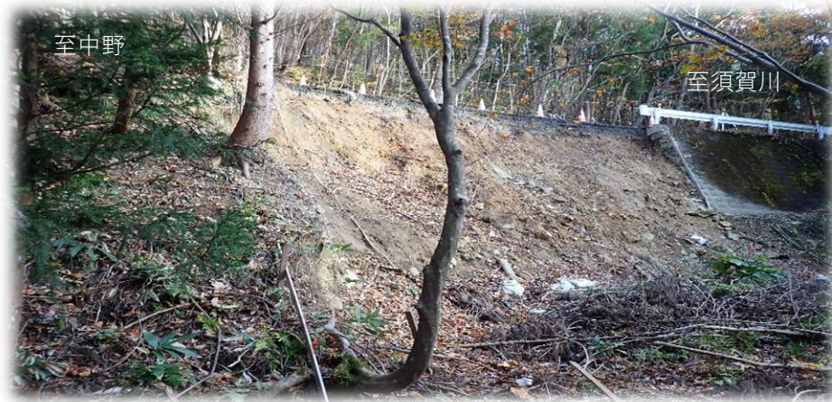
中野方面から須賀川方面を望む