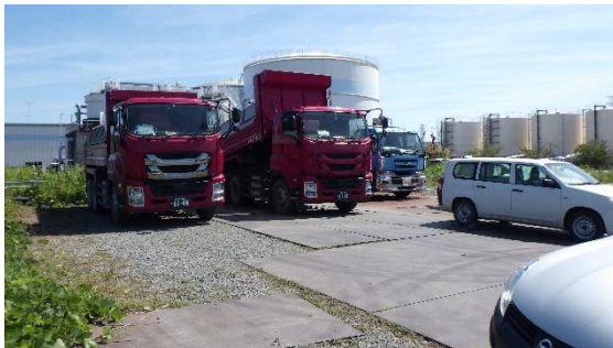
(写真 2 - 2) 掘削した土砂を運搬するトラック (北西側から撮影)