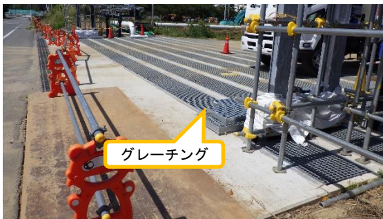
(写真1-1) エリア整備作業の状況① (南東側から撮影)