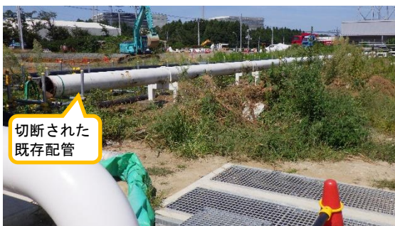
(写真1-3) エリア整備作業の状況③ (南東側から撮影)