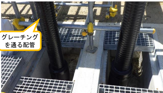
(写真1-2) エリア整備作業の状況② (東側から撮影)