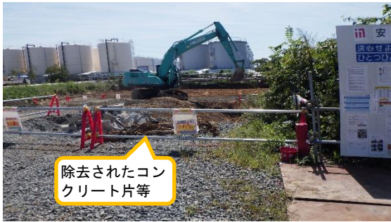
(写真 2 - 1) 掘削作業の状況 (北側から撮影)