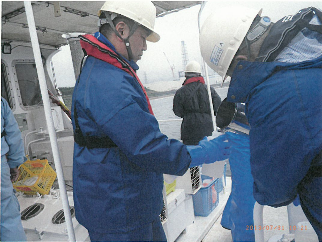
南放水口付近 (10時10分～)