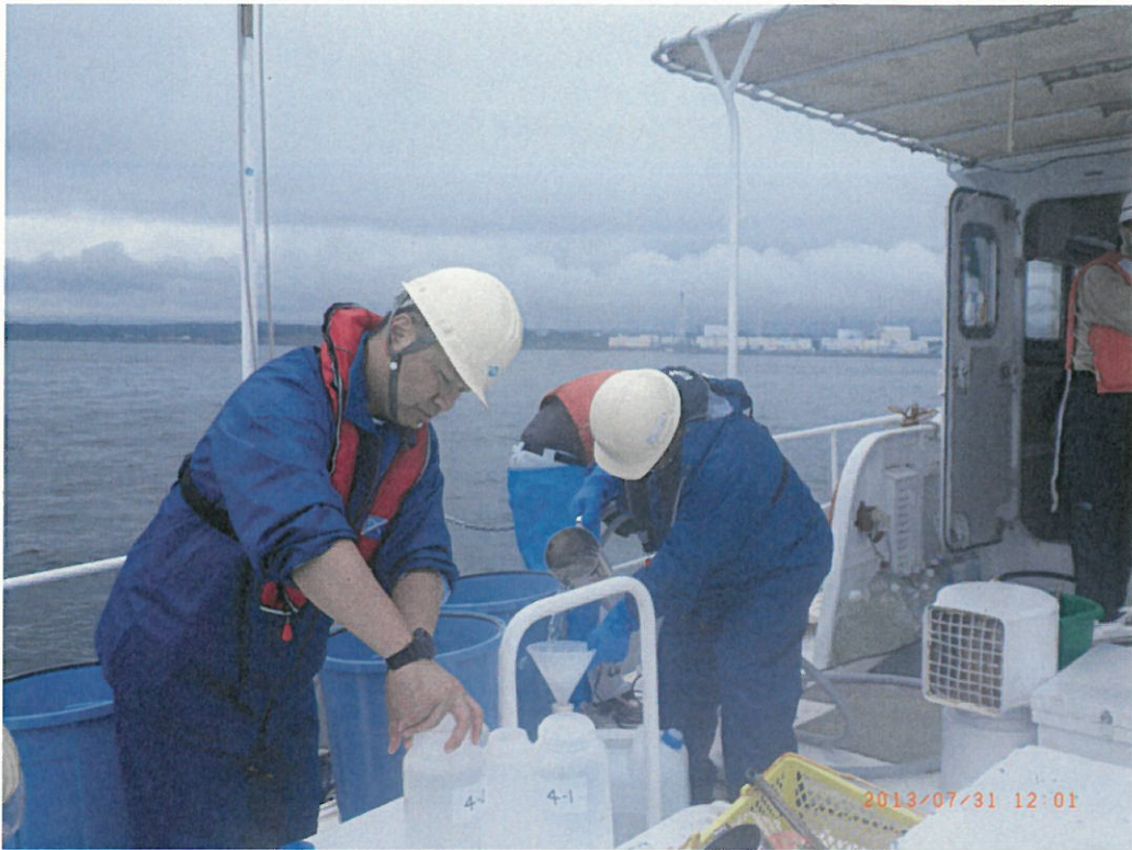
発電所沖合 2 km ( 1 1 時 5 5 分 ~ )