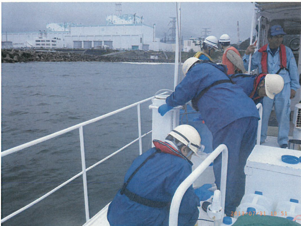
北放水口付近（10時45分～）