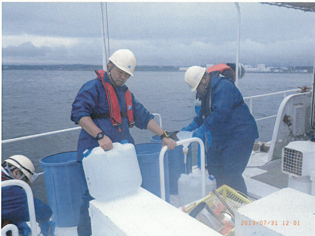
発電所沖合 2 km ( 1 1 時 5 5 分 ~ )