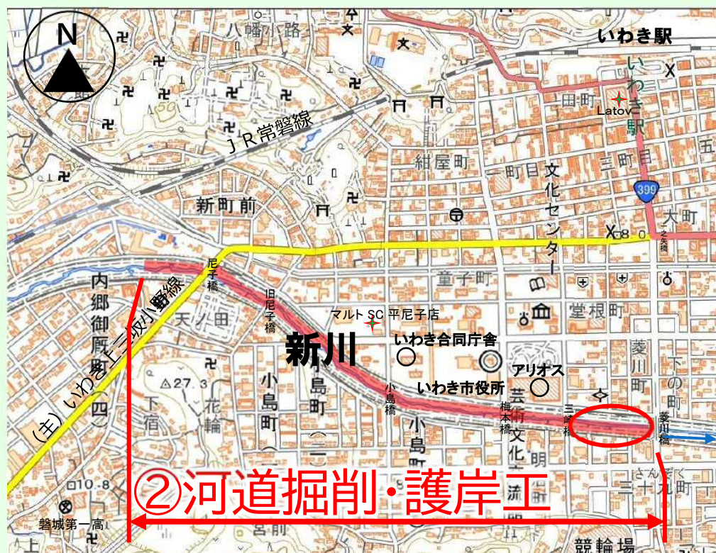
写真 新川の災害復旧や河道掘削等の工事状況について代表的な箇所を掲載しています。