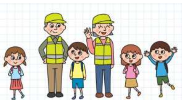
「やってみよう！登下校見守り活動ハンドブック」より ~文部科学省~

現代社会は、ご近所付き合いが希薄になっていると言われます。南会津域内は、「 地域の子供は地域で育てる 」という意識がまだまだ健在な地域だと思いますが、少子高齢化、家族の形態が多様化する中、 持続可能な仕組み が求められているのも現実です。寂しいことですが「昔は〇〇だった」「近所の子供はみんな顔見知り」とはいかないことも…。大切なのは 子育て家庭を孤立させない こと。地域や職場内でも子育てに関する話題をとりあげ、 一人ではない ことを実感できる社会にしていきたいものですね。