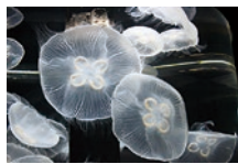
絵本にも登場するクラゲ

子どもから大人まで幅広く知られている海をテーマにした絵本を紹介し、そこに登場する生き物の実物を展示することにより、水族館ならではの企画展を楽しめます。「海の現状」、「不思議」、「多様性」についての展示を通して、自然環境を守る大切さについて学べます。