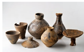
会津若松市一ノ堰B 遺跡出土弥生土器

—これから歴史の学習を始める子どもたちへ— 歴史の教科書は、縄文時代、弥生時代や古墳時代など大昔の事柄(ことがら)からはじまります。そのころの福島はどのような様子だったのでしょうか。県内から出土した資料で、むかしの福島の歴史を紹介します。