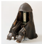
鎖帷子・籠手 土方歳三所用 (土方歳三資料館蔵)

新選組は1863(文久3)年に結成された浪士組を母体とし、京都守護職をつとめた会津藩主松平容保に属して京都の治安維持を担い、戊辰戦争では旧幕府側に立って戦い激動の時代を生きました。本展では会津藩との関係性にも注目しながら、隊士の書簡や所持品、当時を伝える絵画・古文書などの豊富な資料から新選組の足跡をたどります。