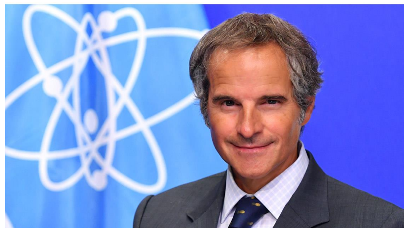
グロッシーIAEA事務局長