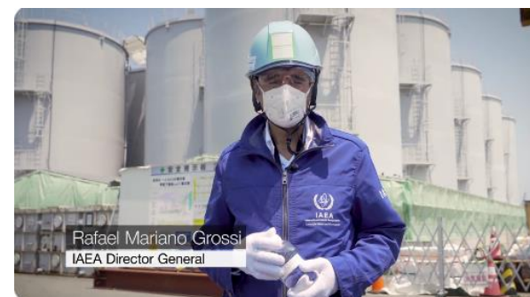
グロッシー事務局長のSNSでの投稿