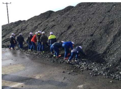
石炭ストックヤード見学