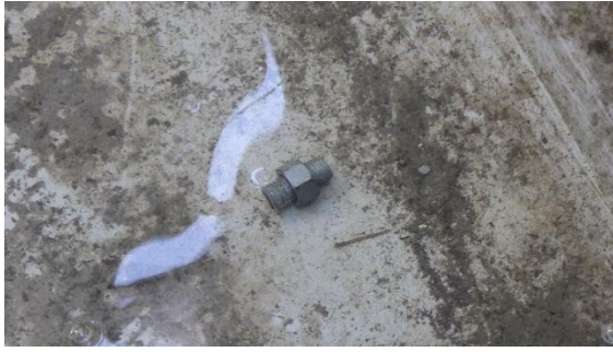
(写真5-2) 破断して下部に落下したボルトの 一例