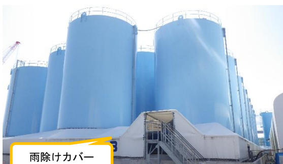
(写真1) Bタンクエリア外観 (北東側から撮影)