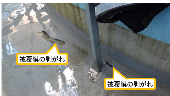
(写真2-1) タンク下部の被覆膜の剥がれや 堰床面の被覆膜に捲れた箇所 の一例①