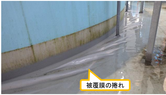
(写真 2 - 2)