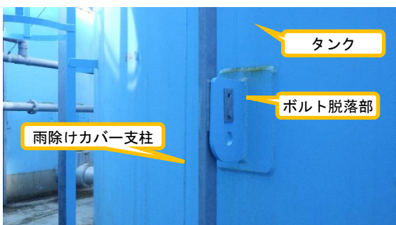
(写真 5 - 1)

メーカー推奨変位値内ではあるが、 変位が確認された連結管（保温材に 覆われている。） (B 1 - B 2 タンク間)