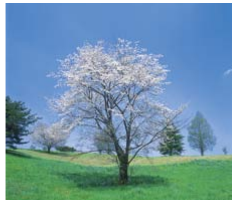
7. 牧草地の桜 (矢吹町) 関矢吹町産業振興課 ☎ 0248-42-2115