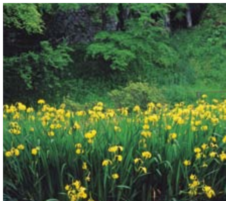
6. 馬陵公園池のカキツバタ (相馬市) 関相馬市商工観光課 ☎ 0244-37-2155