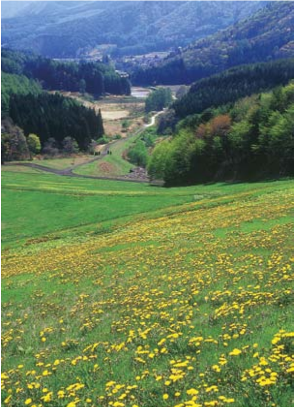
3. 大内ダム斜面に咲くタンポポ (下郷町) ☎ 0241-69-1144