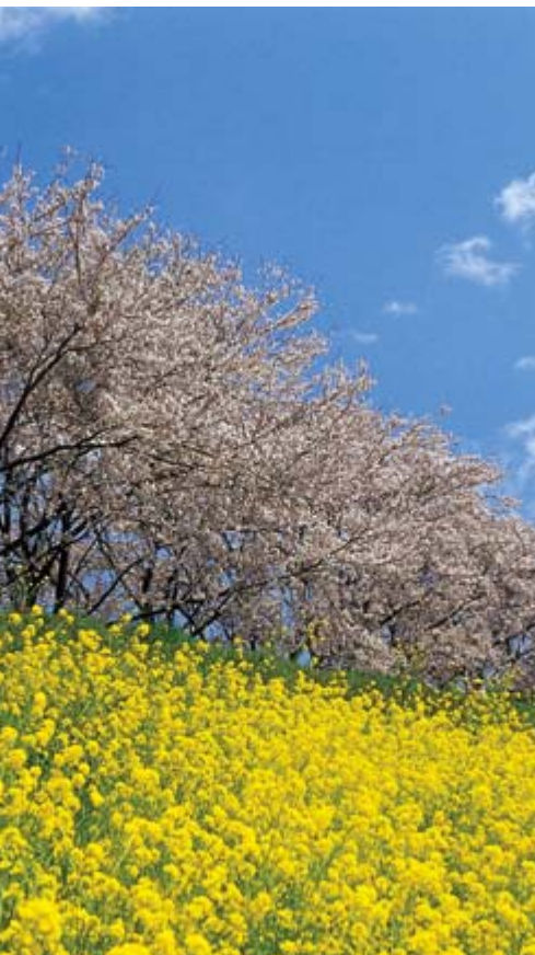
2. 夏井川河川敷の桜と菜の花（いわき市） 問い合わせ総合観光案内所 ☎ 0246-23-0122