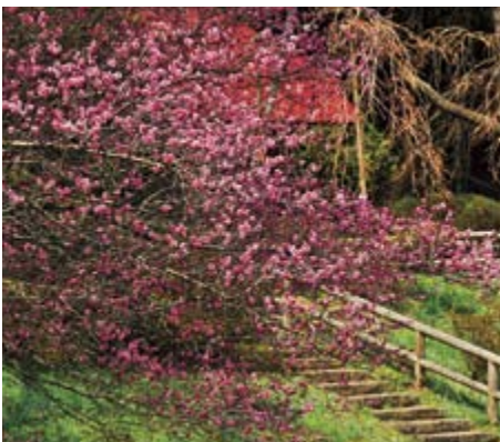
5. 雪村庵の梅 (郡山市) 関郡山市観光協会 ☎ 024-924-2621

色とりどりの花がいつせいに 咲き誇る季節がやってきました。 心まで春色に染まるような、華 やいだひとときの訪れです。 身近な暮らしの中に、そして 少し足をのびた風景の中に、 この季節だけの美しい瞬間を感 じることが出来ます。そんな彩 りの風景を探して、県内各地を 訪れてみてはいかがでしょう。