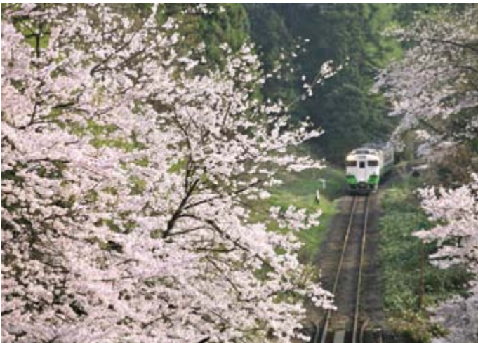
4. 只見線沿線に咲く桜 (会津柳津～郷戸間) 関柳津町観光商工班 ☎ 0241-42-2114

色とりどりの花がいつせいに 咲き誇る季節がやってきました。 心まで春色に染まるような、華 やいだひとときの訪れです。 身近な暮らしの中に、そして 少し足をのびた風景の中に、 この季節だけの美しい瞬間を感 じることが出来ます。そんな彩 りの風景を探して、県内各地を 訪れてみてはいかがでしょう。