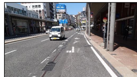
郡山停車場線（郡山市）