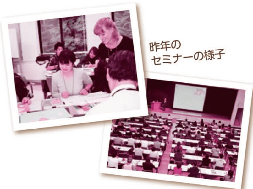
昨年の セミナーの様子

イスラムと聞くとどうしてもネガティブな感情を抱きがちでは?実は、私たちが見聞きするイスラムはごく一部に過ぎません。エジプトのごく普通の庶民の暮らしを知れば、きっと目から鱗のイスラムの新たな姿を発見できるはずですよ。