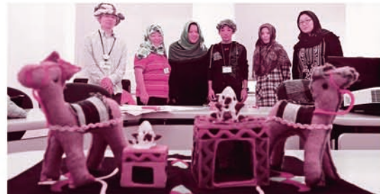
協力隊の私が出会ったエジプトの女性たち