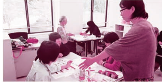
おいしいチョコレートの向こう側