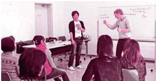
Enjoy a Fun English Conversation Time with the CIRs!