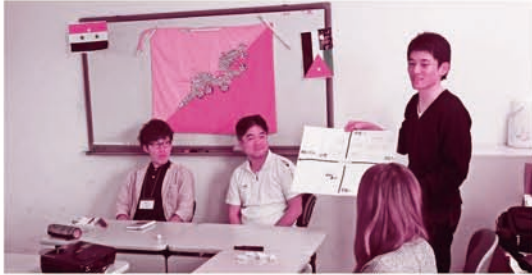
幸せ仕分け ～ブータンの人々の生活から～

自主セッションは、国際交流や異文化理解などに関わる自分の活動について発表したい方や、地球規模の問題についてみんなで考えたい方が自ら講師となって講座を開講するセッションです。海外での体験談や支援活動の話、国際協力・国際理解について考えるワークショップなど、発表を希望する方は参加申込書に必要事項を記入してください。