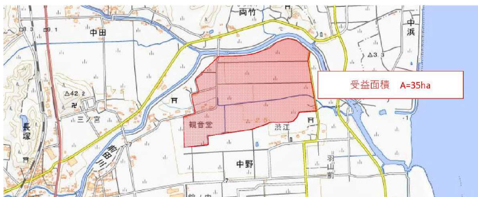
双葉町 両竹地区 事業面積 35ha 調査対象面積 35,000 m 2