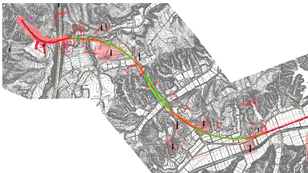
双葉町 県道井出長塚線 調査対象面積 15,000 m 2