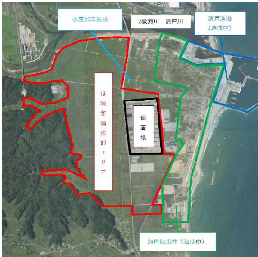
浪江町 請戸地区 事業面積 142ha 調査対象面積 142,000 m 2

◇調査対象面積合計 251,300 m 2 内 今回申請分 163,300 m 2