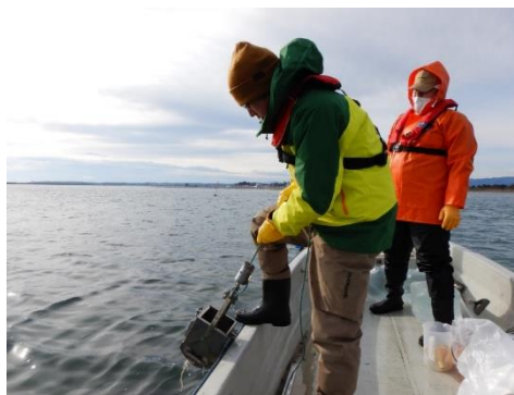
↑ 松川浦における採泥調査

その中で私は、放射性物質が環境中から水産物へ移行する過程を解明するための研究や放射線モニタリング検査に関する業務などを行っています。福島県産水産物の安全安心を確認・発信していくことは、風評を払拭し、水産業の復興を進めていく上で、なくてはならない業務であり、やりがいを感じています。