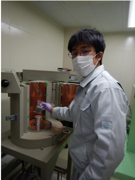
↑ゲルマニウム半導体測定装置による 放射線物質濃度測定

A. 水産資源研究所では、市場での水揚物の調査や調査船に乗船しての底びき網調査などを行いますが、これらは決して1人ではできない、同僚や調査船の乗組員の方々の協力があって初めて実施することができる業務です。そのため、調査について事前に打合せを行うなど、周囲とのコミュニケーションを欠かさないことを意識しています。