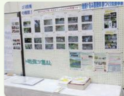
地域文化祭で啓発活動

不法投棄防止啓発、監視パトロール、地域環境整備活動事業(地域内における廃棄物の片付け等)を行う地域住民団体の活動に対し、最大70万円まで補助金を支給する事業を行っています。詳細は最寄りの各地方振興局までお問い合わせください。