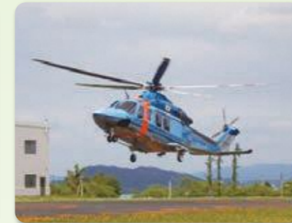
スカイパトロール