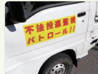
車両による監視パトロール活動